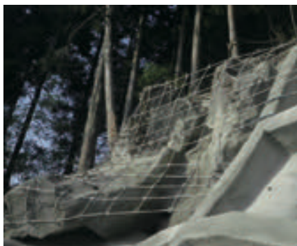
福岡県 ワイヤーロープ掛工