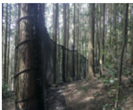
福岡県 立木タイプ落石防護柵