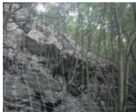
長崎県 ワイヤーネット工