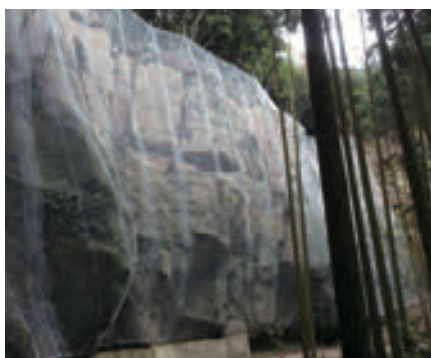
長崎県 ポケット式落石防護ネット