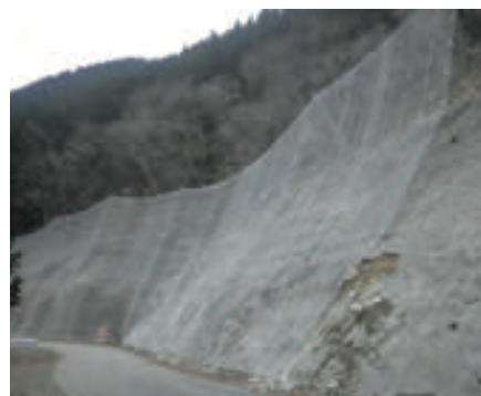
熊本県 高エネルギー型落石防護ネット