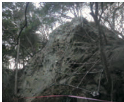
佐賀県 ワイヤーネット工