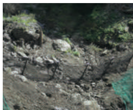
熊本県 落石防護柵