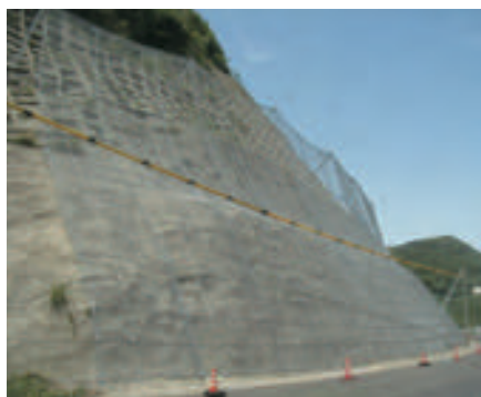
長崎県 高エネルギー型落石防護ネット