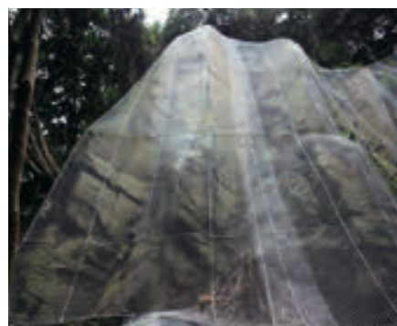
長崎県 覆式落石防護ネット