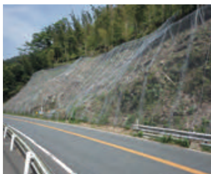
福岡県 ポケット式落石防護ネット