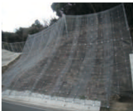
長崎県 高エネルギー型落石防護ネット