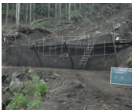
熊本県 落石防護柵